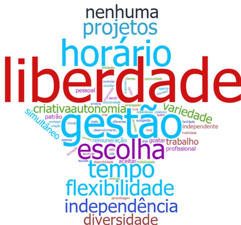
Figura 1 - Vantagens associadas à condição de profissional independente